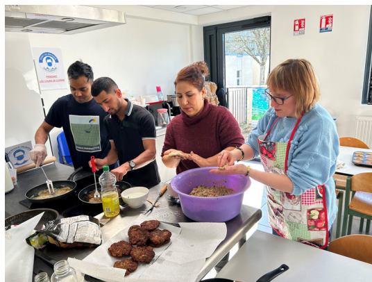
Février: Chapli Kabab afghan proposé par l'AATM