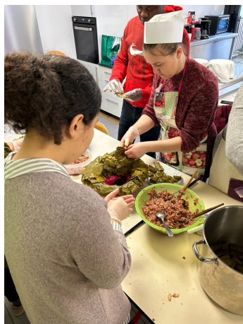
Janvier : Dolmas et Gatas arméniens proposé par l'ANCRE

En 2023, nous mettons en place, une fois par mois, un atelier cuisine en partenariat avec le SARC et le CADA ANCRE. Chaque structure mène l'atelier à tour de rôle en mettant en valeur une recette venant du pays d'un des apprentis cuisiniers. C'est un véritable buffet qui s'organise puisque dix invités par structure peuvent profiter du repas lors d'un temps convivial entre résidents, membres des équipes et habitants du quartier.