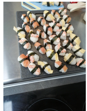
Mars : Sushis japonais proposé par le SARC Newsletter N°1