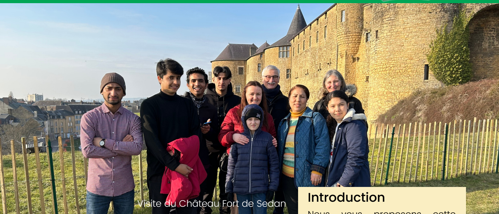
Visite du Château Fort de Sedan